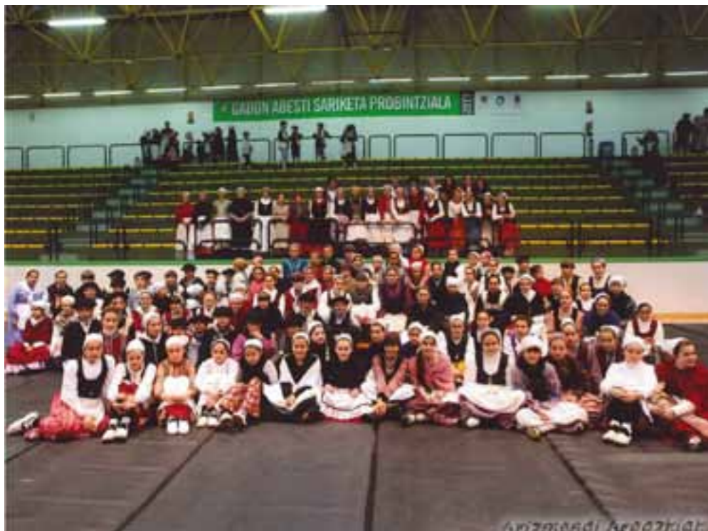
Orereta Txiki. Orereta Gabon Sariketa 2011

Andra Mari abesbatzako harrobi taldeek, 2011. urteari amaiera ezin hobea eman zioten, abenduak 30ean Errenteriako Gabon Sariketa Probintzian, bai Oreretak bai Orereta txikik urrezko garaikurrak lortuz. Aipatzekoa da, 8 – 10 urte bitarteko abeslari ez osatu dagoen Orereta txiki abesbatzak, lehen aldiz urrezko puntuazio hau lortu duela.