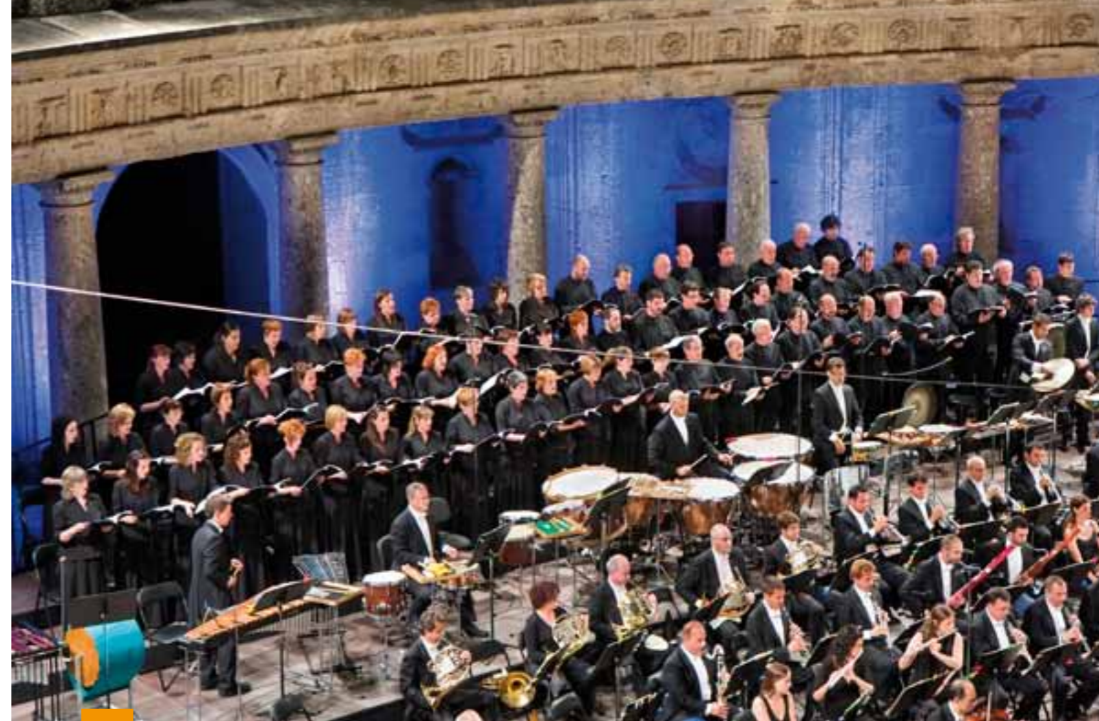
"Festival Internacional de Música y Danza de Granada 2010".

Azkenik, urteroko kurtso amaiera eta gabon kontzertuez gain, Errenteriako ikastetxe guztiekin azken urtean Andra Mari burutzen duen abesbatza proiektua aurretik ere martxan dugu. Harrobi taldeko abeslariak, eskoletako haurrekin batera kantuak landu eta emanaldiak eskainiko dituzte, guretzat garrantzi berezia duen ekimenean.