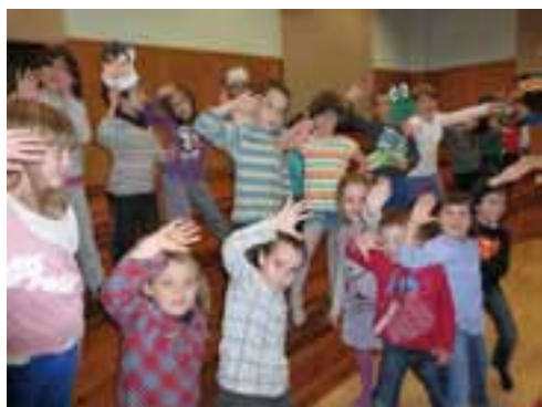
Musika Tailerra 2011