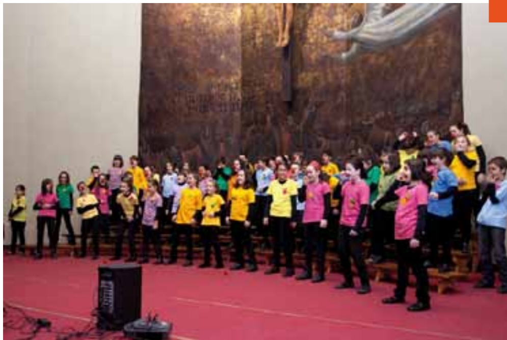
Orereta Txiki 2011