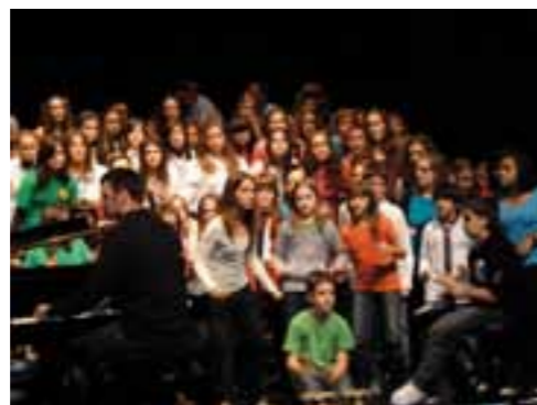
Orereta Nafarroako ekimena 2011