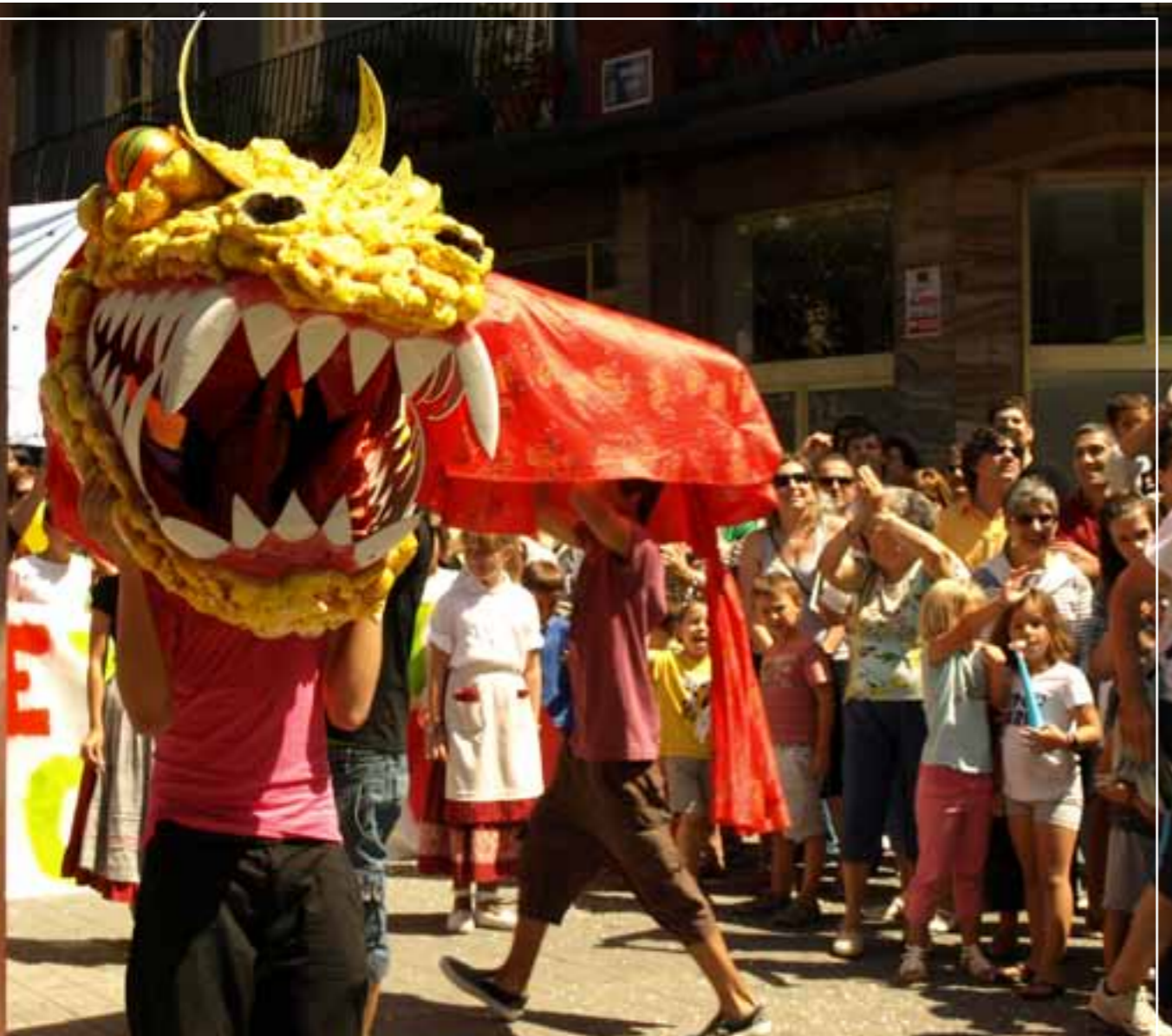
Gurasoek eskainitako ongi-etorria. (2010-07-27)