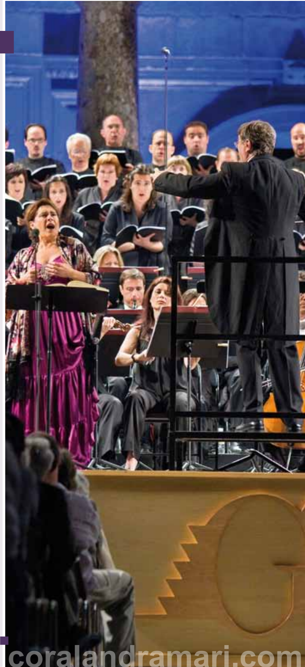
59. Festival Internacional de Música y Danza de Granada